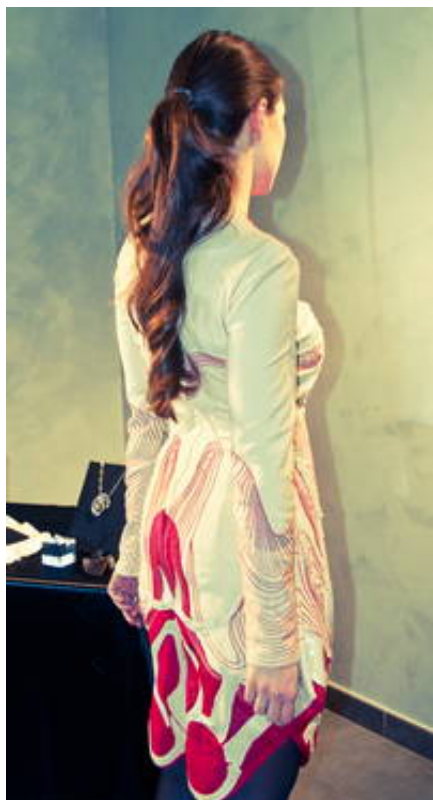
(a cura di Zorica & Cresto Perez Andino)